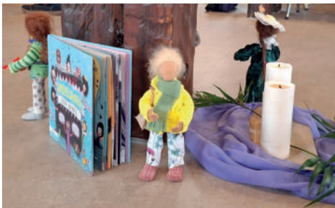
(Text/ Bild: Claudia Fritsche)

Die Pause nutzten viele, um gemeinsam mit dem Tanzkreis aus Sangerhausen das Tanzbein zu schwingen und neue Energie zu tanken. Eine wirkliche Oase im Alltag unserer Heldinnen.